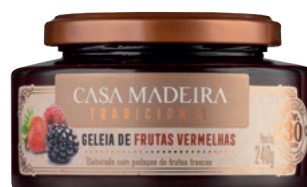
Frutas Vermelhas - 240g GT103UN EAN: 7898070110834 DUN: 17898070110831