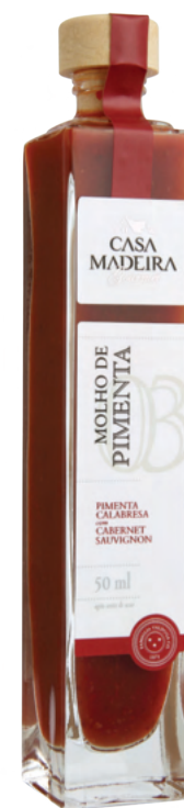
Pimenta Calabresa com Cabernet Sauvignon - 50ml MP307UN