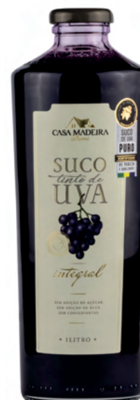
SU012 1 litro