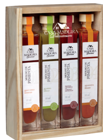
Kit Molho de Pimenta KIT100UN

Geleia Gourmet de Pimenta Geleia Gourmet de Manga com Pimenta Molho de Pimenta Jalapeño com Lúpulo Molho de Pimenta Calabresa com Cabernet Sauvignon