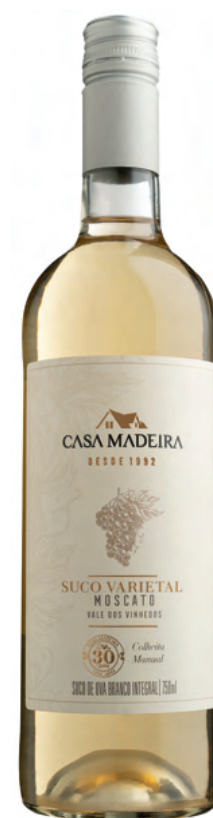
Suco Branco Varietal Moscato SU052GF - 750ml EAN: 7898070112098 DUN: 17898070112095