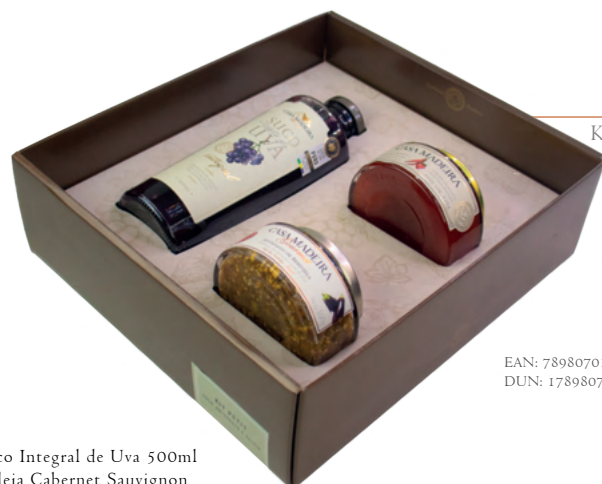
Kit Petit KIT090UN

Com design exclusivo, as embalagens foram especialmente criadas para a Casa Madeira, comportando assim os mais deliciosos produtos.