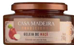
Maça - 240g GO004UN EAN: 7898070110902 DUN: 17898070110909