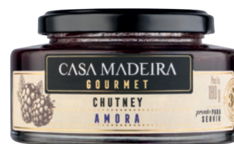
Amora - 180g CT100UN

A linha de chutneys Casa Madeira conta com cinco diferentes sabores: Abacaxi com Gengibre, Amora, Cebola ao Vinho e Anis Estrelado, Manga e Maracujá com Curry.