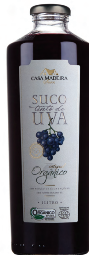
Suco Integral Orgânico

aditivo químico ou conservantes em sua composição. Genuinamente ecológico, apresenta o puro sabor da fruta, respeitando o meio ambiente através da preservação e renovação dos recursos naturais.