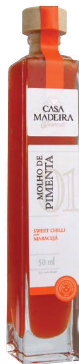
Sweet Chilli com Maracujá - 50ml MP305UN

Cabernet Sauvignon e Malagueta com Brandy, são uma excelente opção para incrementar o sabor das refeições, desde entradas até pratos principais.