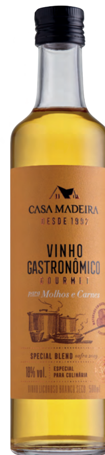
Vinho Gastronômico - 500ml VG002GF EAN: 7898464250320 DUN: 17898464250327

Vinho Gastronômico, elaborado da mistura de chardonnay e riesling, maturado por 24 meses em barrica de carvalho, graduação alcoólica de 18%, ideal para marinadas, molho tipo madeira, fondue, molhos encorpados e sobremesas.