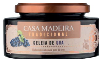
Uva - 240g GO005UN EAN: 7898070110872 DUN: 17898070110879