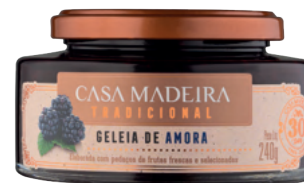
Amora - 240g GT101UN EAN: 7898070110810 DUN: 17898070110817