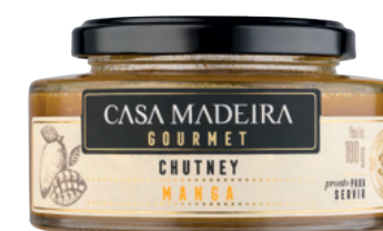
Manga - 180g CT102UN