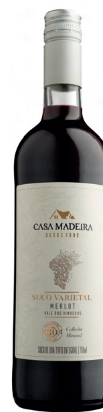
Suco Tinto Varietal Merlot SU054GF - 750ml EAN: 7898070112111 DUN: 17898070112118