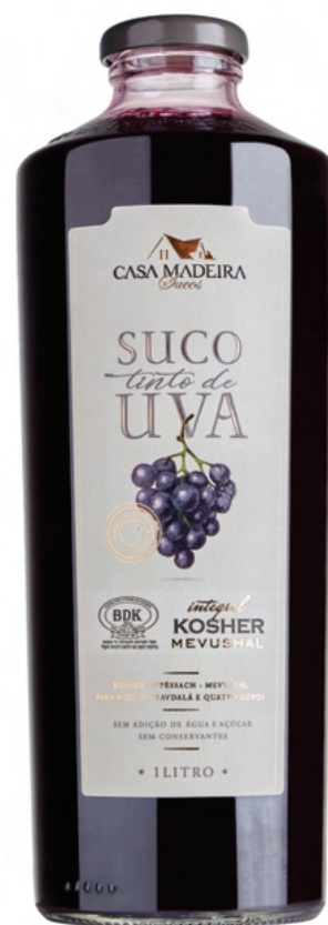
Suco Integral Kosher

O termo Mevushal tem origem hebraica, e significa 'fervido'. Este processo de pasteurização, onde o suco é rapidamente fervido e resfriado, tem por objetivo apresentar para um judeu uma bebida pura, seguindo suas próprias leis