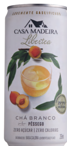
Chá Branco Pêssego levemente gaseificado

O Chá Branco com Pêssego revela o caráter delicado da fruta de forma sutilmente refrescante.