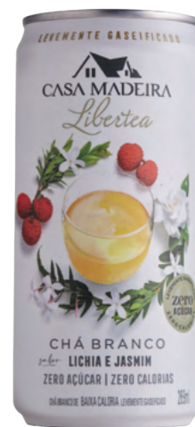
Chá Lichia e Jasmim levemente gaseificado