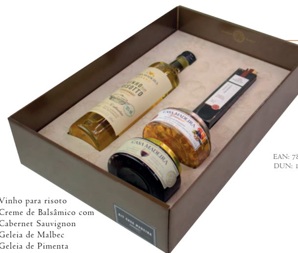
Kit Gourmet KIT063UN

Suco Integral de Uva 500ml Geleia Gourmet de Uva Geleia Gourmet de Frutas Vermelhas Geleia Gourmet de Pimenta