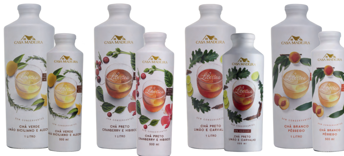
Chá Verde Limão Siciliano e Alecrim

incrível e refrescante combinação. O Chá Branco com Lichia e Jasmim revela o adocicado e marcante aroma da fruta em plena harmonia com a delicadeza do aroma floral do jasmim. O Chá Preto com Cranberry e Hibisco apresenta aromas intensos, com notas frutadas de cranberry que são complementadas por delicadas nuances florais. Já o Chá Preto com Limão e Carvalho possui sabores marcantes. O caráter fresco e frutado do limão é complementado pelo toque amadeirado do carvalho, resultando em uma deliciosa combinação.