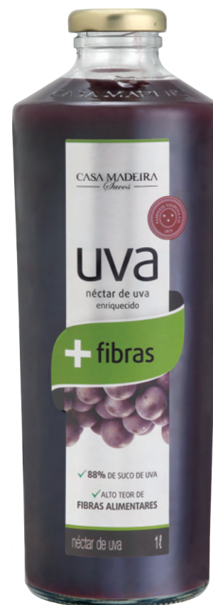
Fibras - 1 litro SU038GF

promovem a sensação de saciedade e auxiliam para o bom funcionamento do intestino. Seu consumo é destinado a pessoas de todas as idades e deve estar associado a uma alimentação equilibrada e hábitos de vida saudáveis.