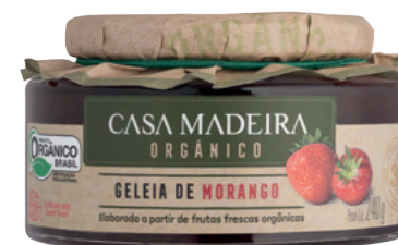
Morango - 240g OR103UN EAN: 7898070111763 DUN: 17898070111760