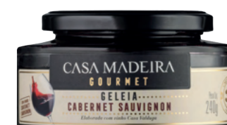
Cabernet Sauvignon - 240g GG204UN