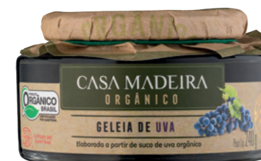
Uva - 240g OR102UN EAN: 7898070111510 DUN: 17898070111517