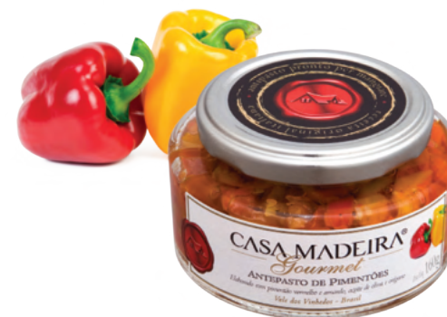
Pimentões - 160g