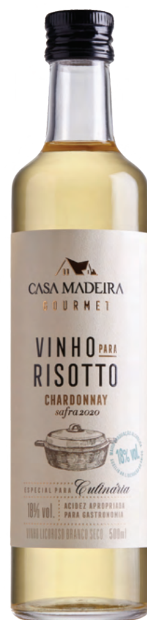
Vinho para Risotto - 500ml VG001GF EAN: 7898464250092 DUN:17898464250099