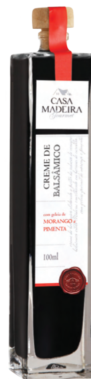
Com geleia de Morango com Pimenta - 100ml CB102UN