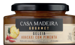
Abacaxi com Pimenta - 240g GG213UN