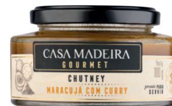
Maracujá com Curry - 180g CT101UN