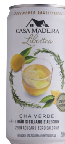
Chá Verde Limão Siciliano e Alecrim levemente gaseificado