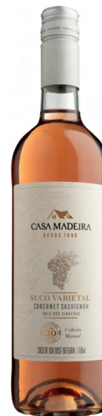
Suco Rosé Varietal Cabernet Sauvignon SU053GF - 750ml EAN: 7898070112104 DUN: 17898070112101