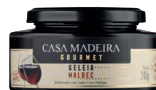
Malbec - 240g GG203UN