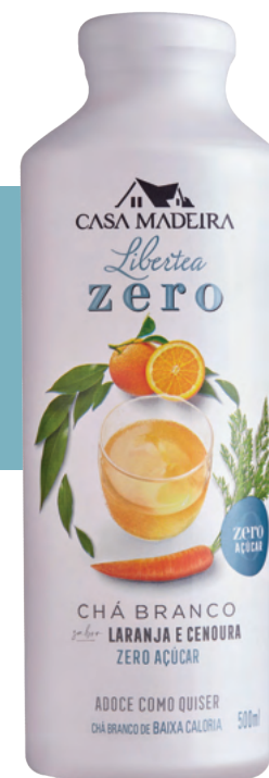
CHÁ BRANCO Laranja e Cenoura CH408UN - 500ml EAN: 7898464250108 DUN: 17898464250105