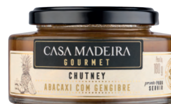
Abacaxi com Gengibre - 180g CT103UN