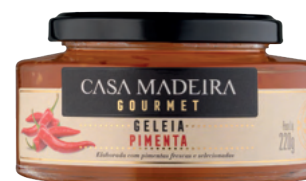
Pimenta - 240g GG210UN