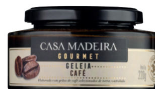
Café - 240g GG209UN