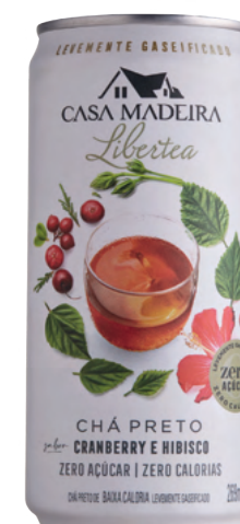
Chá Preto Cranberry e Hibisco levemente gaseificado