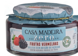
Frutas Vermelhas GZ103UN