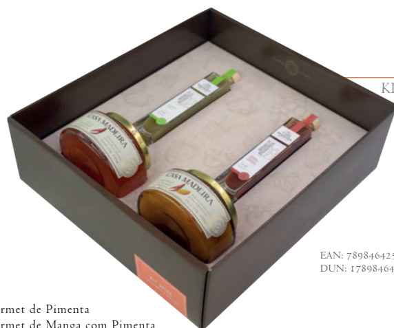
Kit Spice KIT124UN

Geleia Gourmet de Laranja Geleia Gourmet de Morango Chá Liberteia Lichia e Jasmim 500 ml