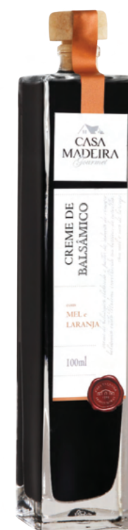
Com mel e laranja - 100ml CB103UN