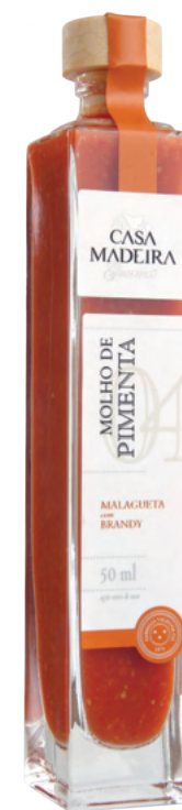
Malagueta com Brandy - 50ml MO308UN