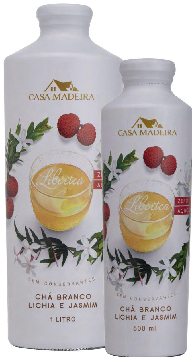
Chá Branco Lichia e Jasmim

CH401GF - 500ml EAN: 7898070111814 DUN: 17898070111814