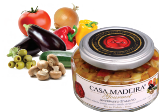
Italiano - 160g