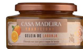
Laranja - 240g GT109UN EAN: 7898070110339 DUN: 17898070110336