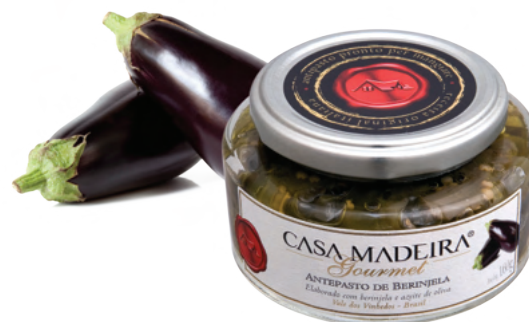
Berinjela - 160g