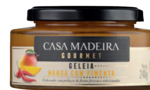
Manga com Pimenta - 240g GG214UN