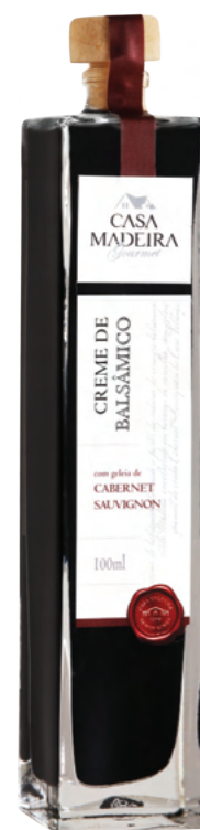
Com geleia de Cabernet Sauvignon - 100ml CB101UN