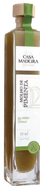
Jalapeño com Lúpulo - 50ml MP306UN