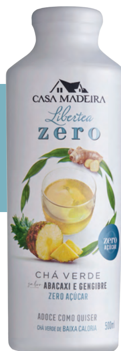
CHÁ VERDE Abacaxi e Gengibre CH407UN - 500ml EAN: 7898464250115 DUN: 17898464250112