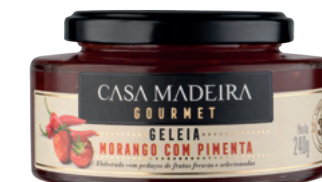
Morango com Pimenta - 240g GG201UN