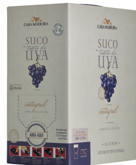
Bag-in-box 3 litros