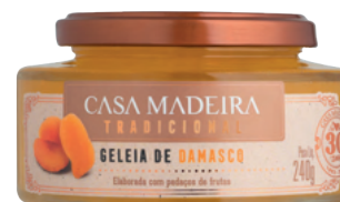
Damasco - 240g GT107UN EAN: 7898070111299 DUN: 17898070111296