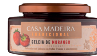
Morango - 240g GT102UN EAN: 7898070110803 DUN: 17898070110800