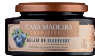
Mirtito (Blueberry) 240g GG205UN EAN: 7898070110940 DUN: 17898070110947