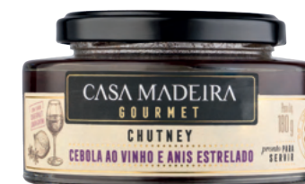
Cebola ao Vinho e Anis Estrelado - 180g CT104UN