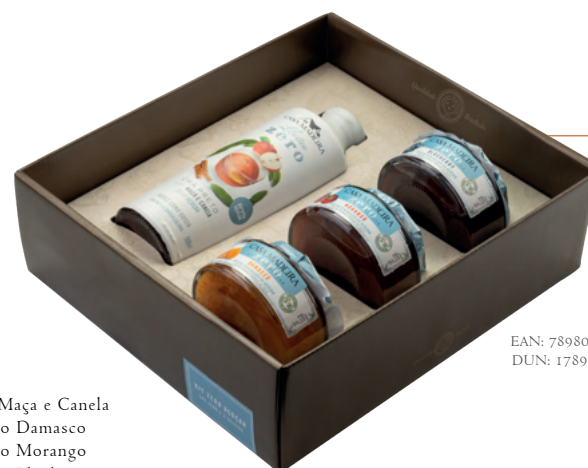
Kit Zero KIT125UN

Vinho para risoto Creme de Balsâmico com Cabernet Sauvignon Geleia de Malbec Geleia de Pimenta