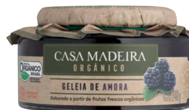
Amora - 240g OR101UN EAN: 7898070111527 DUN: 17898070111524