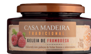
Framboesa 240g GT110UN EAN: 7898464250221 DUN: 17898464250228