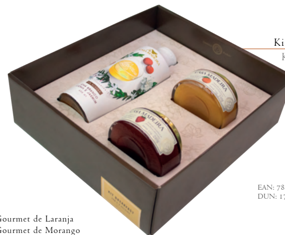
Kit Breakfast KIT101UN

Suco Integral de Uva 500ml Geleia Cabernet Sauvignon Geleia Gourmet de Morango com Pimenta