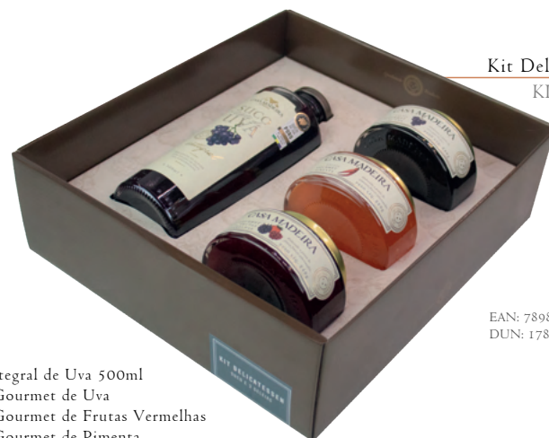
Kit Delicatessen KIT062UN

Com design exclusivo, as embalagens foram especialmente criadas para a Casa Madeira, comportando assim os mais deliciosos produtos.